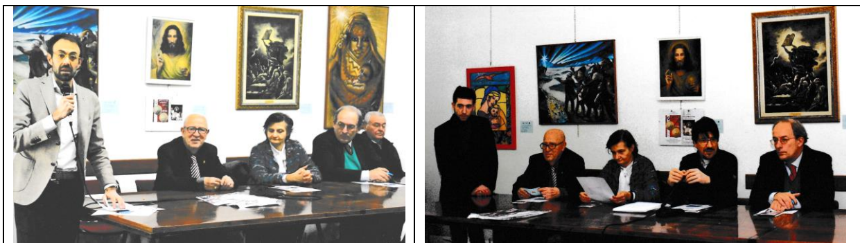
INAUGURAZIONE DELLA MOSTRA DI ARTE SACRA – IL PRESIDENTE DI MUNICIPIO 4 MILANO E GLI ALTRI ORATORI

Allegati: lettera alla F.A.S.I., foto del nuovo Direttivo, foto mostra Arte Sacra